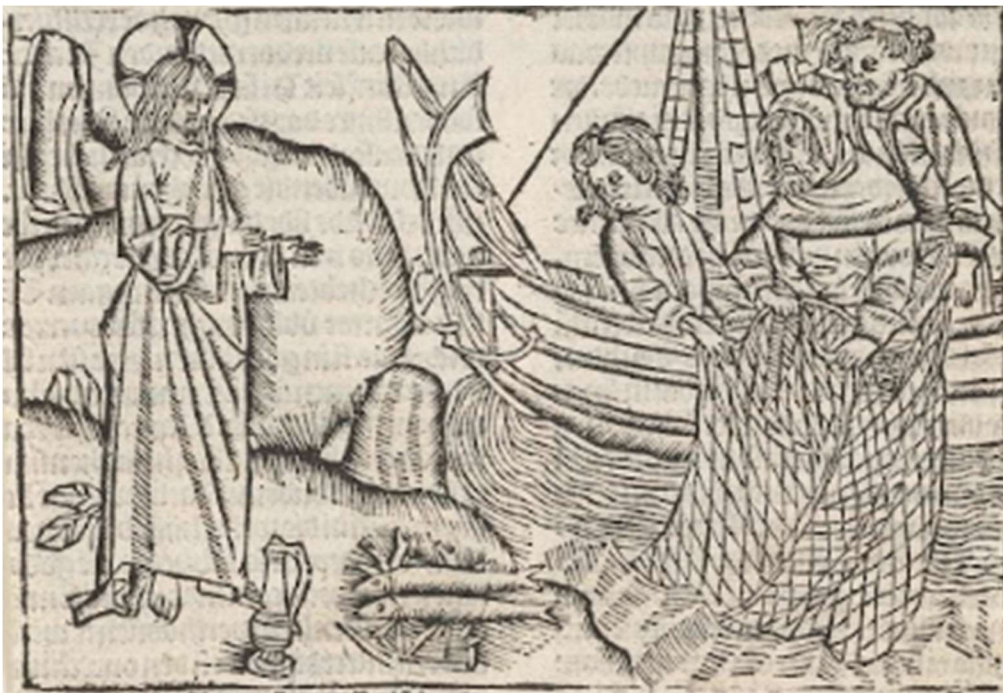
Wonderbare visvangst toegeschreven aan meester van Delft, ca. 1503

Van: Bette Westera, overgenomen uit: Heel de wereld wordt wakker, Het beste van de moderne kolderpoëzie, 2023