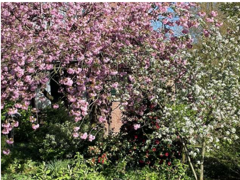
voortuin Tiny Kool