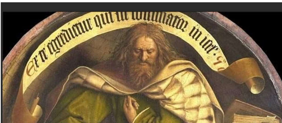
Jan van Eyck, profeet Micha